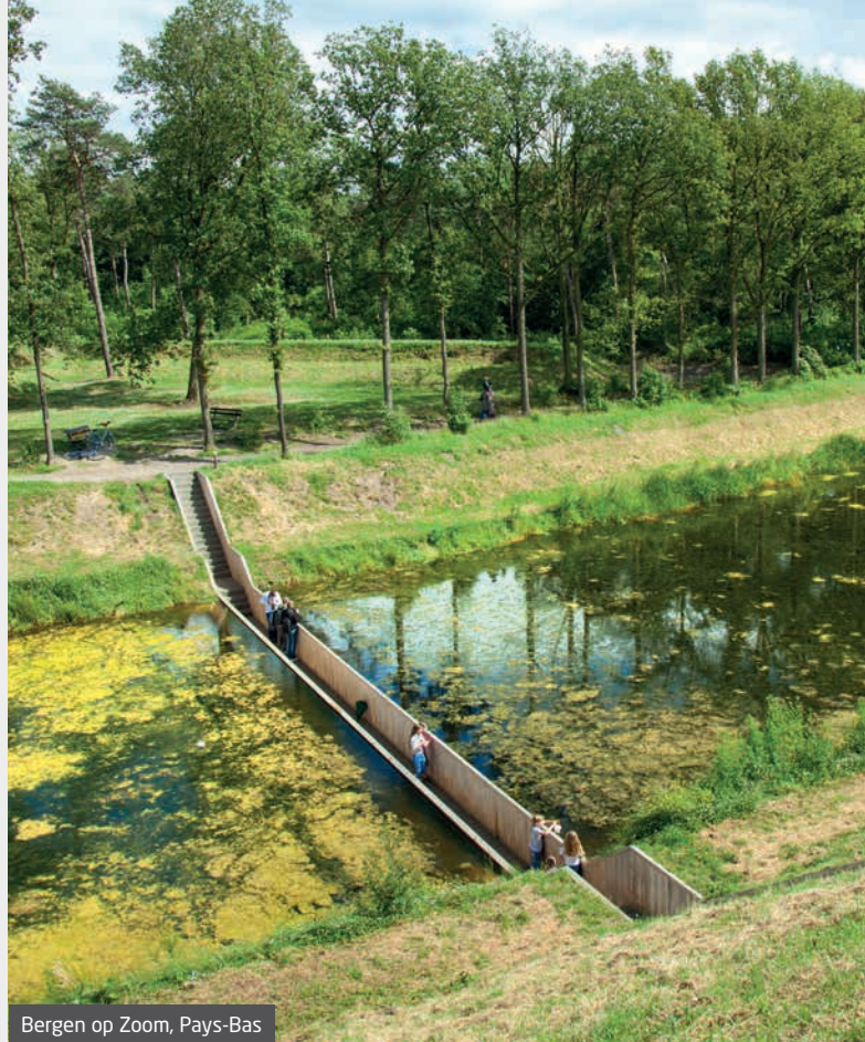
Bergen op Zoom, Pays-Bas

Ce bois-là existe: il s'agit du bois Accoya®, le leader mondial du bois massif haute technologie.